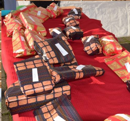
Na het zoeken van de gluurpietjes kreeg elk kind een cadeautje en pepernoten