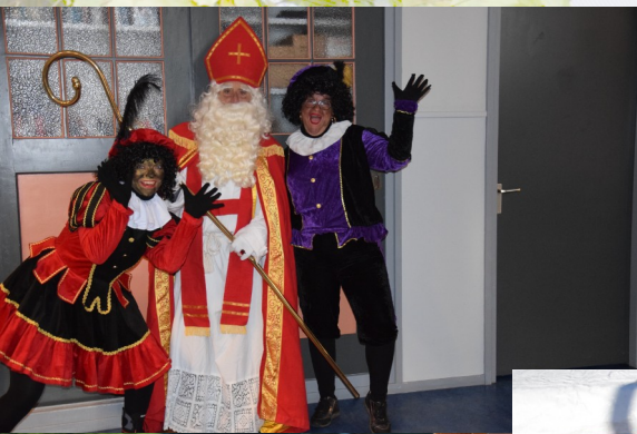
Sinterklaas coronaproef op bezoek bij het Heidehuus.